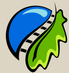
Gemenci Állami Erdei Vasút Pörböly

programok lebonyolítását a gyermekek, diákok számára. A bejelentett csoportok számára igény szerint étkezésre is van lehetőség.